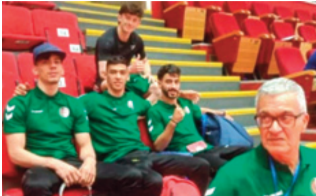
internationale et vise à leur permettre d'acquiescer davantage d'expérience au plus haut niveau.

lors de cette compétition internationale réunissant plusieurs spécialistes mondiaux de la discipline. La Fédération algérienne de gymnastique a, à cette occasion, exprimé ses encouragements aux athlètes engagés dans ce rendez-vous mondial, leur souhaitant "bonne chance et beaucoup de succès" lors de cette épreuve. Cette participation s'inscrit dans le cadre de la présence régulière des gymnastes algériens sur la scène