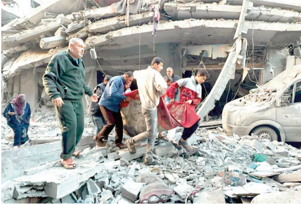
Younes, au sud de la bande de Ghaza, précise Wafa.