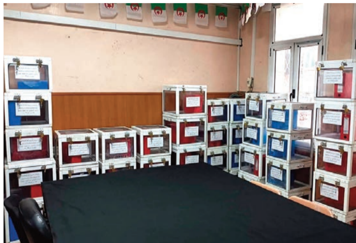
les wilayas d'Oum El Bouaghi, Bou Arreridj, Tébessa, Khenchela, Bouira, Tamanrasset, Sétif, Bordj et In Salah. Elles ont permis de

Conformément aux instructions du ministre Saïd Sayoud visant à garantir une pleine disponibilité logistique pour les échéances électorales, ces missions d'inspection ont concerné